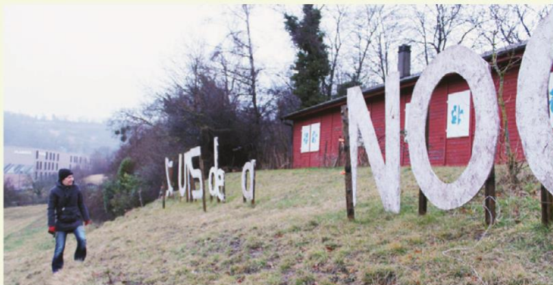
Images d'archives du vandalisme chez les scouts de la Venoge en février.